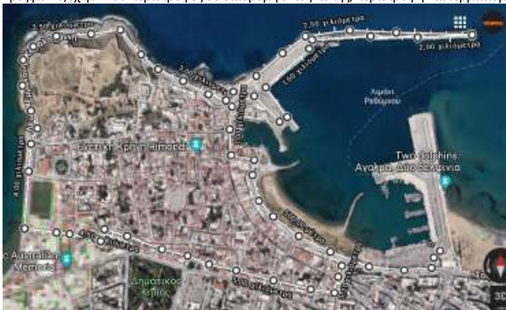
Εκκίνηση: Παραλία αγάλματος δύο δελφινιών. Τερματισμός: Πλατεία Αγνώστου Στρατιώτη