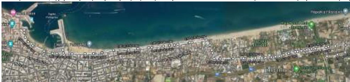
Τρέξιμο 10,6χλμ - Δύο περιστροφές σε διαδρομή εντός πόλης, περιστροφή και τερματισμός στην Πλατεία Αγνώστου Στρατιώτη